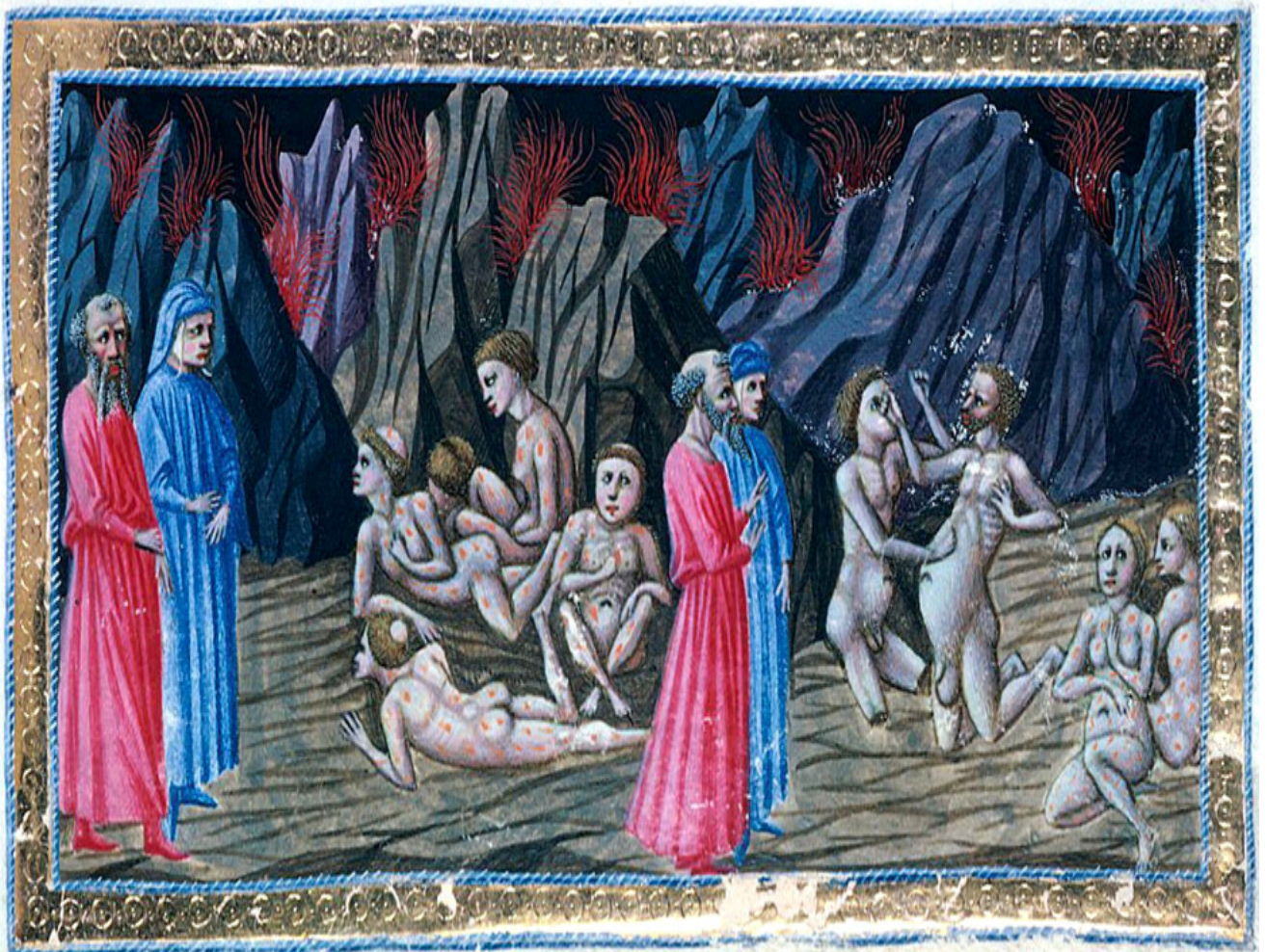
Priamo della Quercia: La rissa tra Mastro Adamo e Sinone – vv. 100-148

Epatopatia congestizia o fegato da stasi Reflusso epato-giugulare Segno di Kussmaul Epatopatia congestizia o fegato da stasi Ascite Idrotorace Anoressia, nausea e dolore addominale Malnutrizione e cachessia