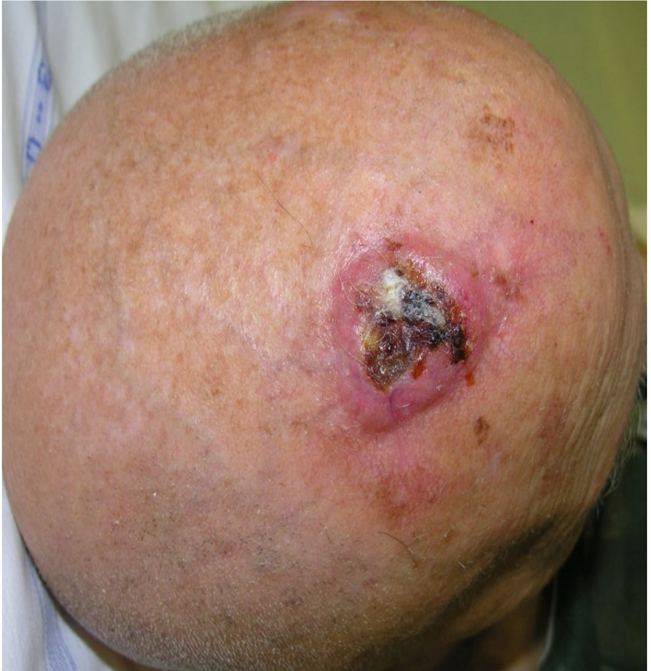
Fig. 6. Carcinoma a cellule squamose invasivo: trattamento chirurgico.