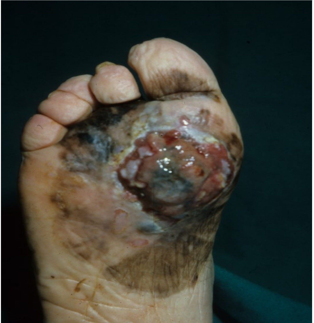
Fig. 4. Melanoma cutaneo avanzato.

Nel convegno è stato sottolineato come i dati epidemiologici relativamente ai NMSC siano altamente sottostimati (nonostante ciò sono i tumori a più alta incidenza nella popolazione), questo perché alcuni Registri tumori non registrano i NMSC e quando sono registrati questo avviene solo per i carcinomi basocellulari e a cellule squamose. La maggior fonte dati dei Registri sono i referti istologici, ma molti carcinomi cutanei soprattutto iniziali sono trattati ambulatorialmente non chirurgicamente, talvolta senza effettuare esame istologico. Tuttavia il dato di incidenza dei nuovi casi di NMSC in Italia nel 2024 è di oltre 120.000 e sono stati presentati i dati di un recente studio epidemiologico-statistico che fanno ipotizzare che nel real-word i nuovi casi incidenti di NMSC in Italia possano essere oltre 400.000 ogni anno.