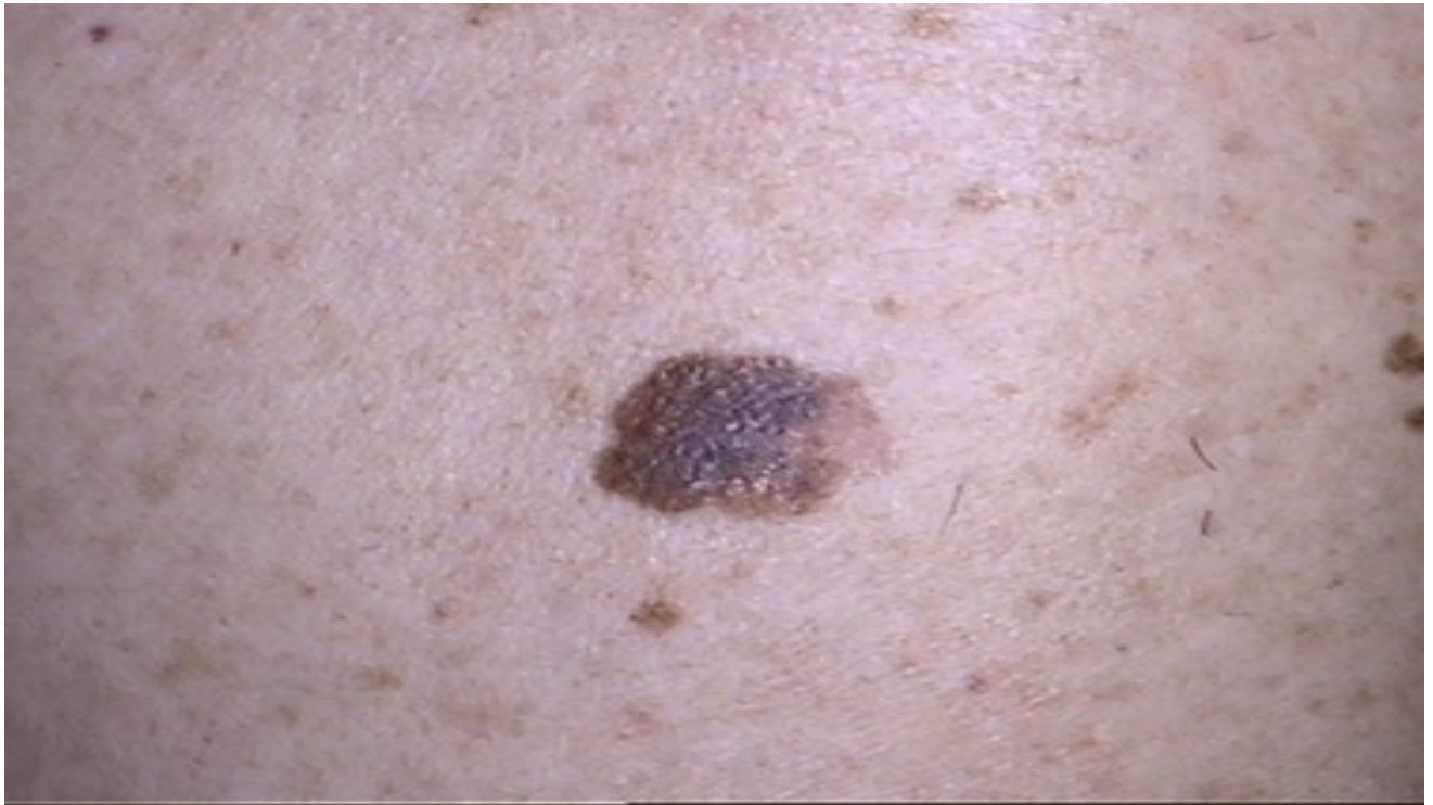
Fig. 1. Melanoma cutaneo 'sottile'.