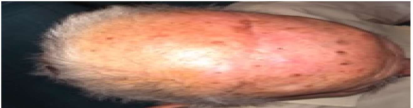
Fig. 7 B: le tecniche di chirurgia plastica ricostruttiva hanno comunque permesso una asportazione radicale e contestuale ricostruzione con lembo bipedunculato.

La chirurgia del melanoma sta evolvendo sempre più in una chirurgia di precisione, mini-invasiva, radio-guidata (Fig. 8), in associazione spesso sequenziale con i nuovi farmaci impiegati anche nel setting adiuvante.