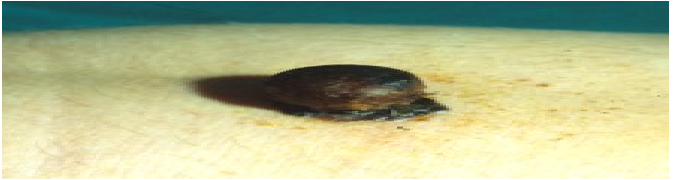
Fig. 3. Melanoma cutaneo nodulare.