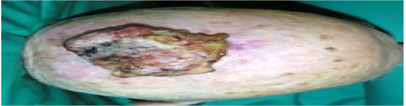
Fig. 7. A: Carcinoma a cellule squamose avanzato.