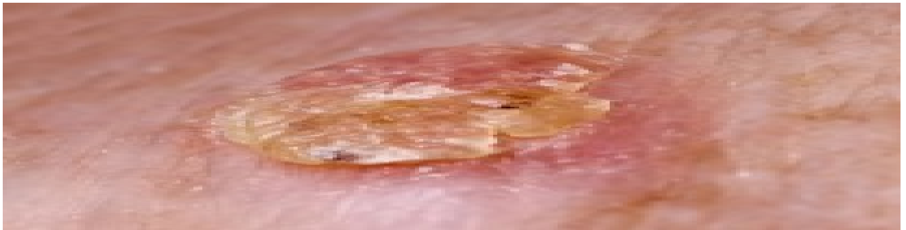
Fig. 5. Cheratosi attinica: spesso il carcinoma a cellule squamose inizia con lesione analoga a questa (carcinoma a cellule squamose in situ ), che può essere efficacemente trattata in ambito dermatologico.

Fondamentale il ruolo della diagnosi precoce anche nei NMSC, in particolare nei carcinomi cutanei e nei loro precursori, cheratosi attiniche in primis (Fig. 5), con le numerose e nuove possibilità di trattamento non invasive sia per le precancerosi che per le forme iniziali di carcinomi della cute.