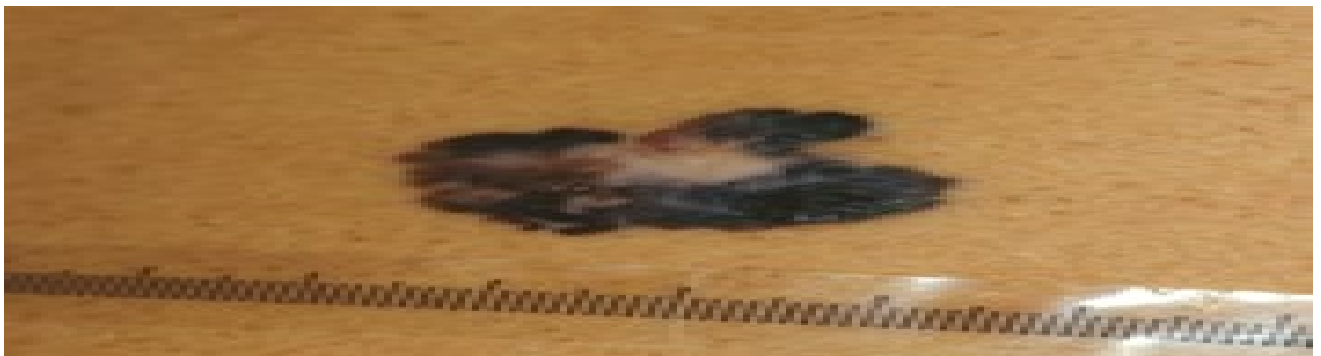
Fig. 2. Melanoma cutaneo 'spesso' con area di regressione.