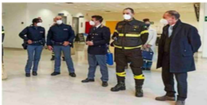
La visita del questore al San Luca